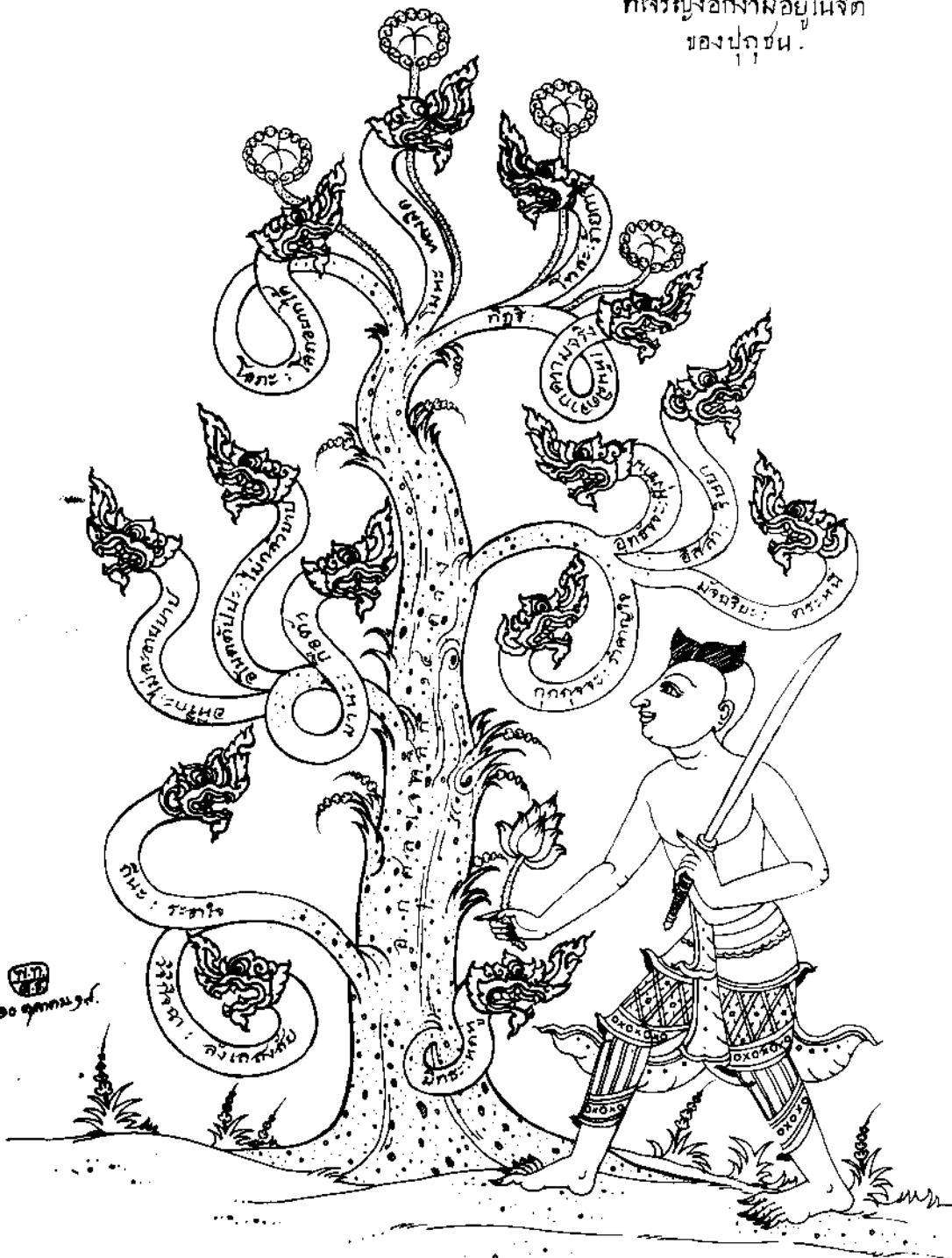
ภาพต้นไม้พิษ

มีคำอธิบายอยู่ที่ หน้า ๔๒๐, ๔๒๑, ๔๒๒, ๔๒๗